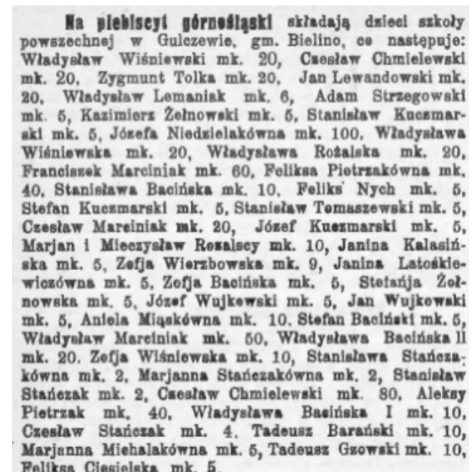
Rys.2. Anons, Kurier Płocki z 25 lutego 1921 roku.