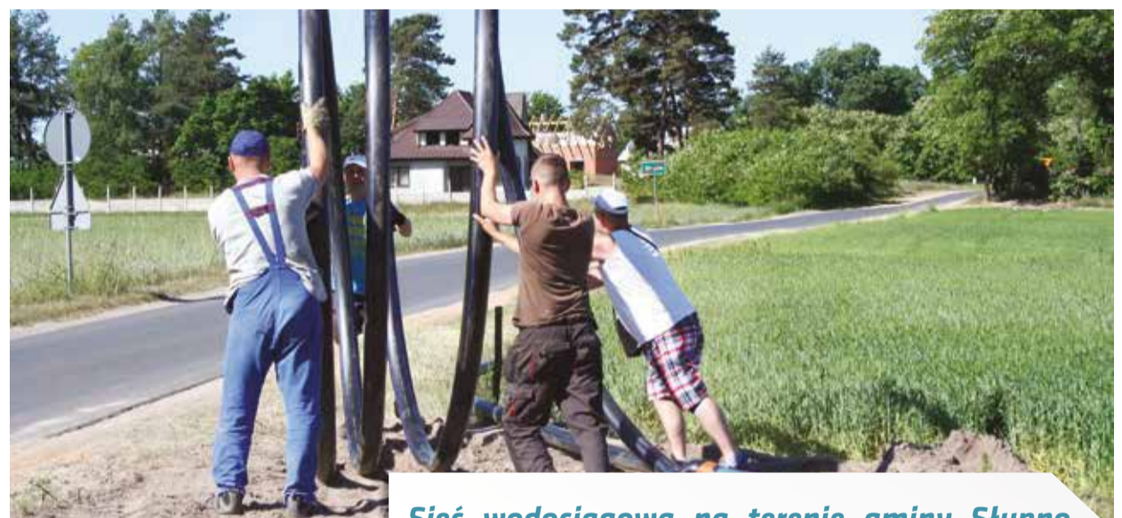
Pracownicy Urzędu Gminy podczas prac nad przewidywanym podłączeniem wody.

Sieć wodociągowa na terenie gminy Słupno jest niewydolna i wymaga nowych inwestycji. Inaczej w wielu domach, szczególnie na terenie samego Słupna, może latem zabraknąć wody.