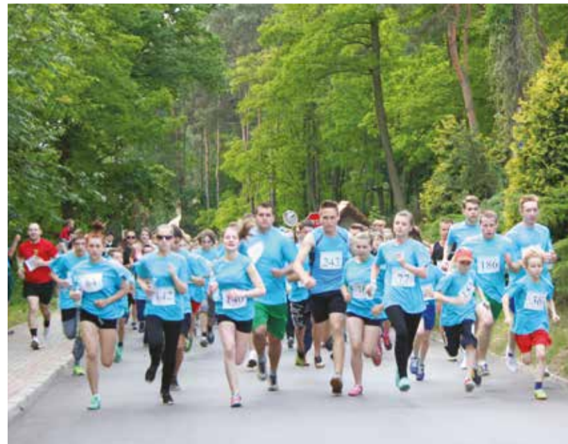
Uczestnicy biegu na 3,5 km – tuż po starcie, więc na razie jeszcze w zwartej grupie.

„Rok temu wystartowałem w Słupnie po raz pierwszy. Na 3,5 km. Ledwo wtedy dobiegłem, na mecie umierałem. To był koszmar. I wtedy coś we mnie pękło. Wziąłem się za siebie i efekty przysły: niedawno pokonałem maraton, o półmaratonach nawet już nie wspominałem”.