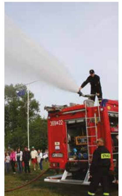
Nie zawiedli strażacy z OSP Słupno, którzy urządzili duuuży prysznic!