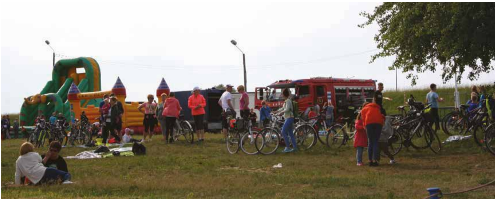
We „Flisie” rowerzyści odpoczywali, jedli przysmaki z grilla, a dzieci oczywiście szalały na dmuchańcach.