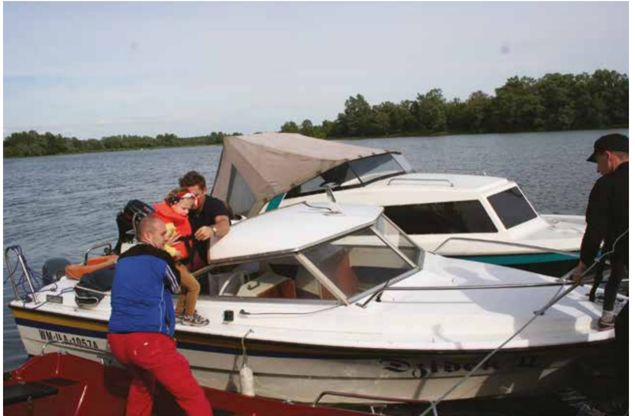
Każdy chętny mógł popłynąć motorówką.