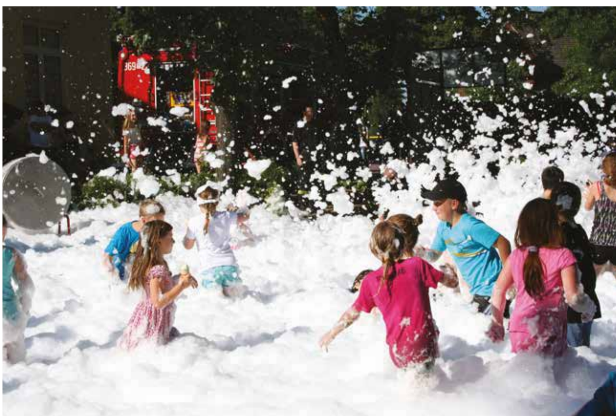
Atrakcją dla dzieci była „kąpiel” w pianie, przygotowana przez strażaków z OSP Słupno.