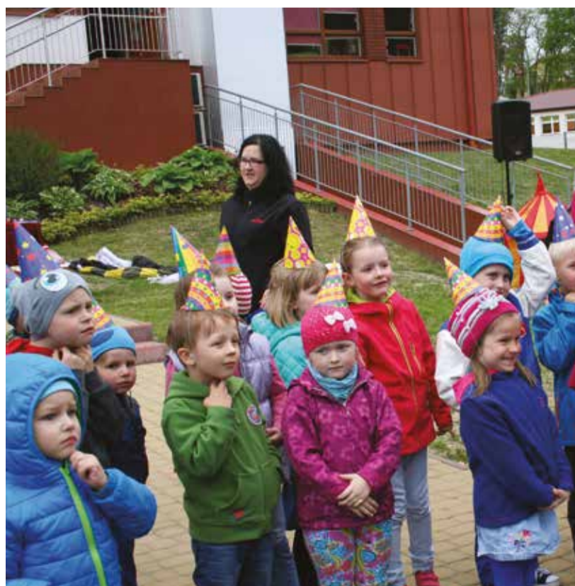
Gminny Żłobek w Słupnie będzie się mieścić w kilku dostosowanych dla maluchów pomieszczeniach przedszkola.