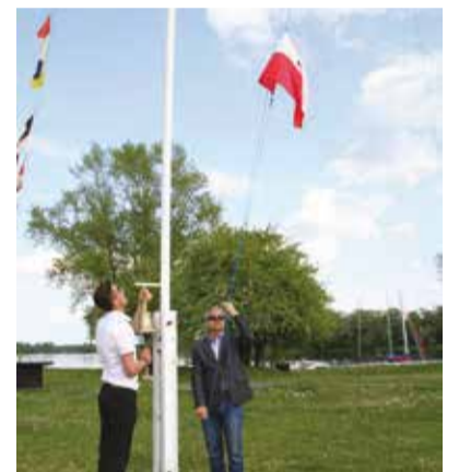
To już ósmy sezon we „Flisie”.