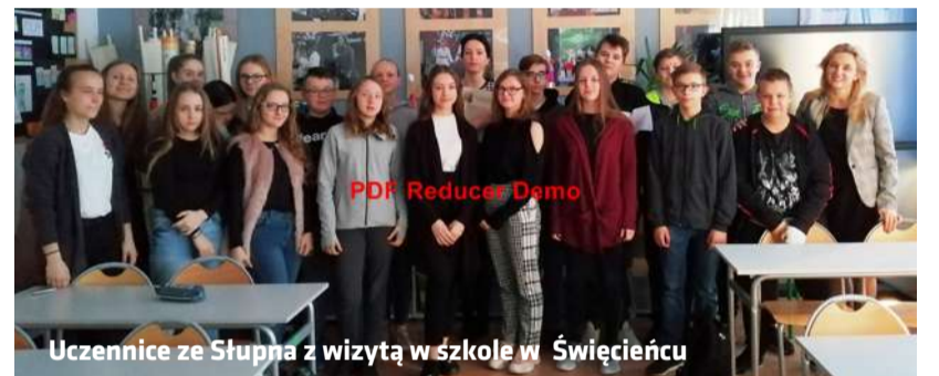
Ucennice ze Słupna z wizytą w szkole w Świącieńcu