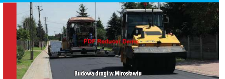
Budowa drogi w Mirosławiu