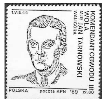
Znaczek poczty drugiego obiegu