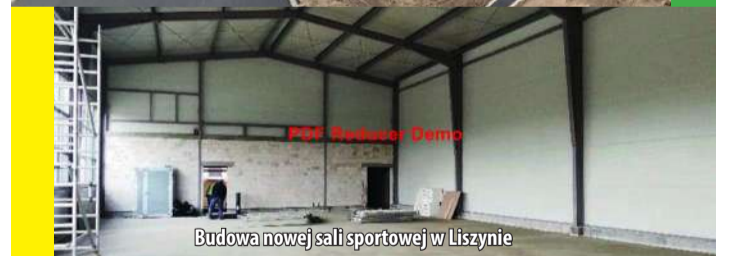
Budowa nowej sali sportowej w Liszynie