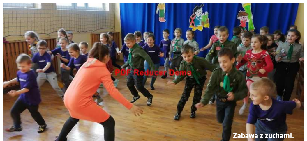
Zabawa z zuchami.

i uczestnikami ciekawych doświadczeń i eksperymentów, np. poznawały tajniki malowania na mleku, sprawdzały, dlaczego zgasł płomień świecy itp.). Starsze koleżanki i koledzy z klas I i II również stanęli na wysokości zadania i troskliwie opiekowali się gośćmi, pomagając w sprawnym wykonaniu wielu zadań. Na wszystkich uczestników czekała też smaczna i zdrowa przekąska w postaci jogurtu z owocowym kleksem. (GM)