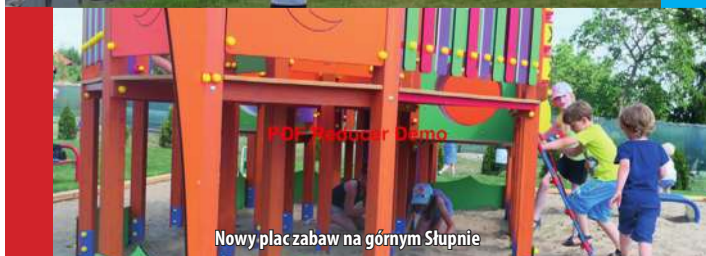
Nowy plac zabaw na górnym Słupnie

Chcesz, aby Nasza Gmina, w której mieszkasz, miała więcej środków finansowych na budowę dróg, chodników, ścieżek rowerowych, placów zabaw i obiektów sportowych, więcej pieniędzy na inwestycje, oświatę, kulturę i sport?