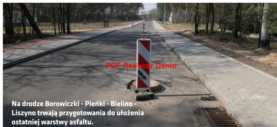
Na drodze Borowiczki - Pieńki - Bielino - Liszyno trwają przygotowania do ułożenia ostatniej warstwy asfaltu.