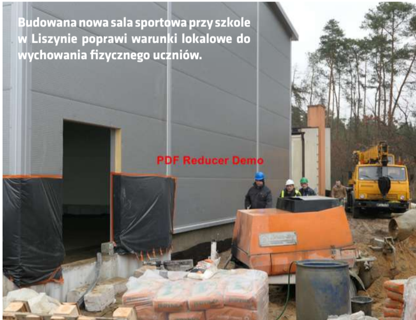
Budowana nowa sala sportowa przy szkole w Liszynie poprawi warunki lokalowe do wychowania fizycznego uczniów.