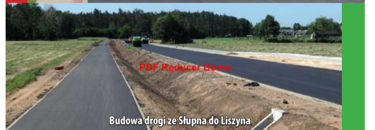
Budowa drogi ze Słupna do Liszynie