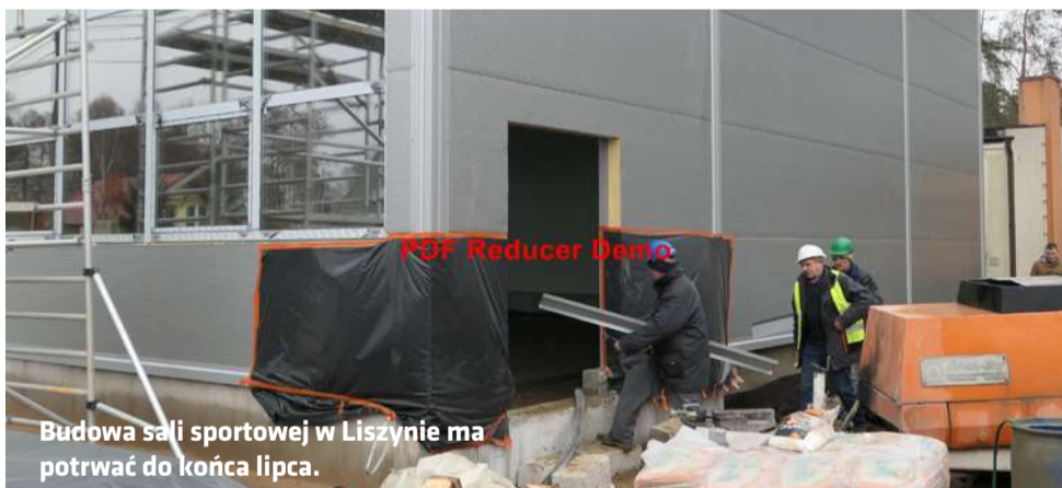
Budowa sali sportowej w Liszynie ma potrwać do końca lipca.