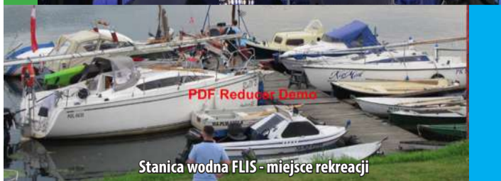
Stacja wodna FLIS - miejsce rekreacji