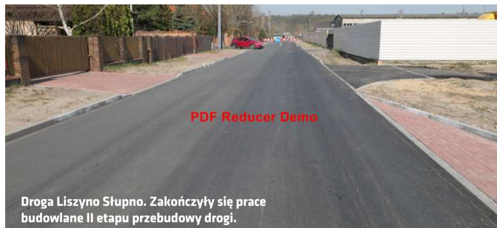
Droga Liszyno Słupno. Zakończyły się prace budowlane II etapu przebudowy drogi.