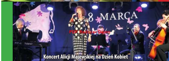
Koncert Alicji Majewskiej na Dzień Kobiet