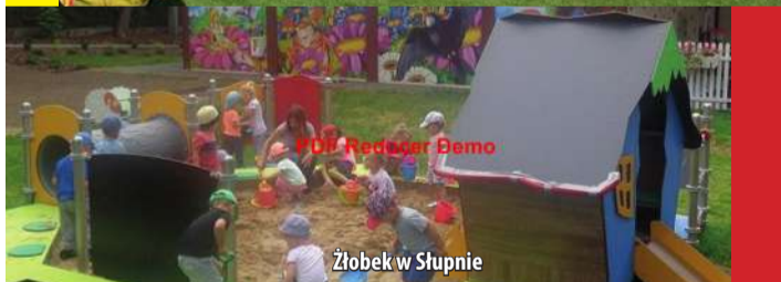
Żłobek w Słupnie