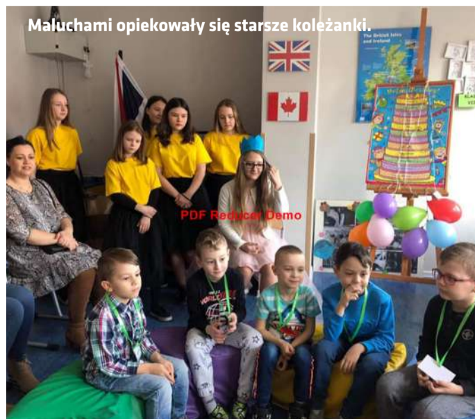
Maluchami opiekowały się starsze koleżanki.

miczne. Po intelektualnych zmaganiach mogły wykazać się ruchowo na sali gimnastycznej, gdzie czekał na nich wyczerpujący tor przeszkód. Tego dnia nie zabrakło też zdrowych przekąsek. Dzieci dowiedziały się, jak jeść zdrowo i kolorowo. Z owoców układały przeróżne wzory np. owieczki, sowy, pawie, a następnie z apetytem je zjadały. Przez cały czas przedszkolkom towarzyszyły starsze koleżanki, które tańczyły, malowały buzie, zaplatały dziewczynom warkoczki oraz robiły zdjęcia w foto budce. Na pamiątkę spotkania w szkole dzieci otrzymały niespodzianki, które na pewno przydadzą się w pierwszej klasie. Przedszkolaki z wymalowanymi bużkami i w doskonałych humorach opuścili Szkołę Podstawową im. Małego Powstańca w Świącieńcu, która czeka na nich ponownie pierwszego września.