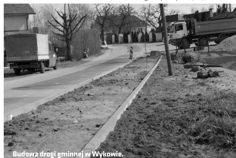
Budowa drogi gminnej w Wykowie.

Przygotowano dokumentację przetargową na budowę oświetlenia ulicznego w Borowiczkach-Pieńkach, Cekanowie, Szeligach, Bielinie, Nowym Gulczewie i Wykowie. Ponadto gmina sporządziła wykaz lamp oświetlenia ulicznego do zamontowania w bieżącym roku na terenie gminy Słupno. (aw)