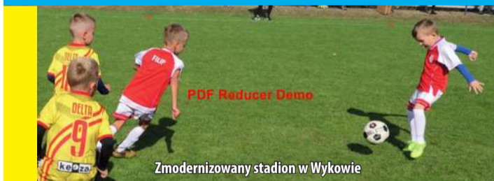
Zmodernizowany stadion w Wykowie