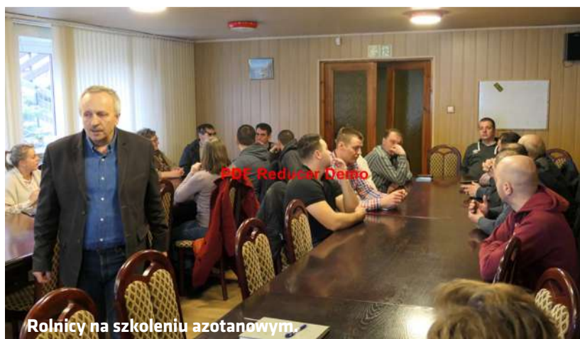
Rolnicy na szkoleniu azotanowym.

Za nieprzebranie zasad programu azotanowego rolnika mogą spotkać kary finansowe ze strony Inspekcji Ochrony Środowiska w wysokości od 500 zł do 3 tys. zł oraz potrącenia płatności bezpośrednich. Informacje o nieprawidłowościach w poszczególnych gospodarstwach ze strony IOŚ trafiają bezpośrednio do Agencji Restrukturyzacji i Modernizacji Rolnictwa. (aw)