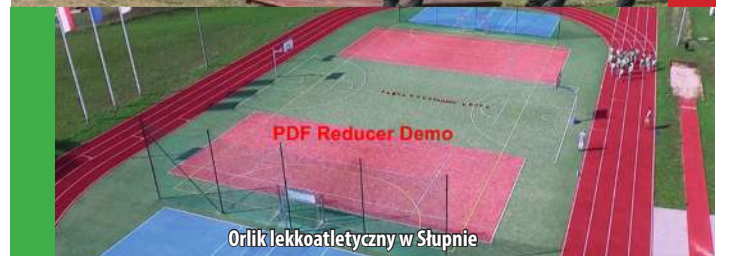
Orlik lekkoatletyczny w Słupnie