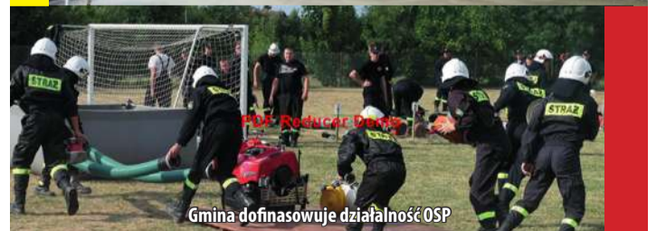
Gmina dofinansuje działalność OSP