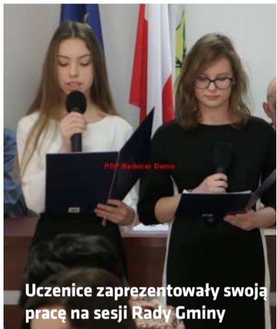
Ucennice zaprezentowały swoją pracę na sesji Rady Gminy

W tym roku projekt nosi tytuł „Postowie II Rzeczypospolitej – ich