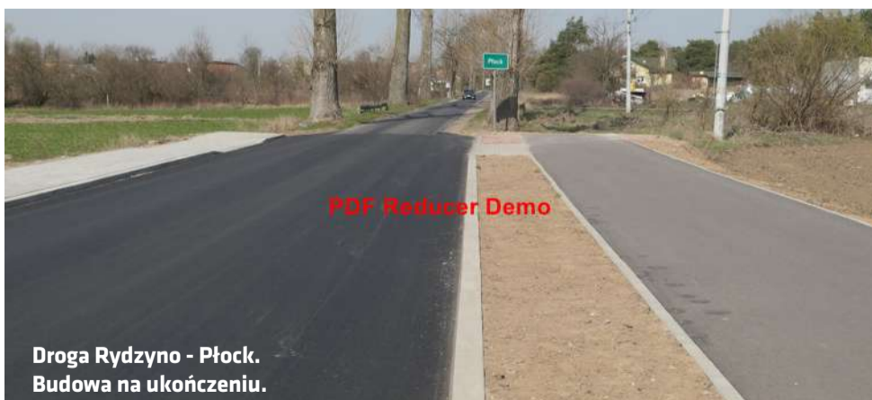
Droga Rydzyno - Płock. Budowa na ukończeniu.