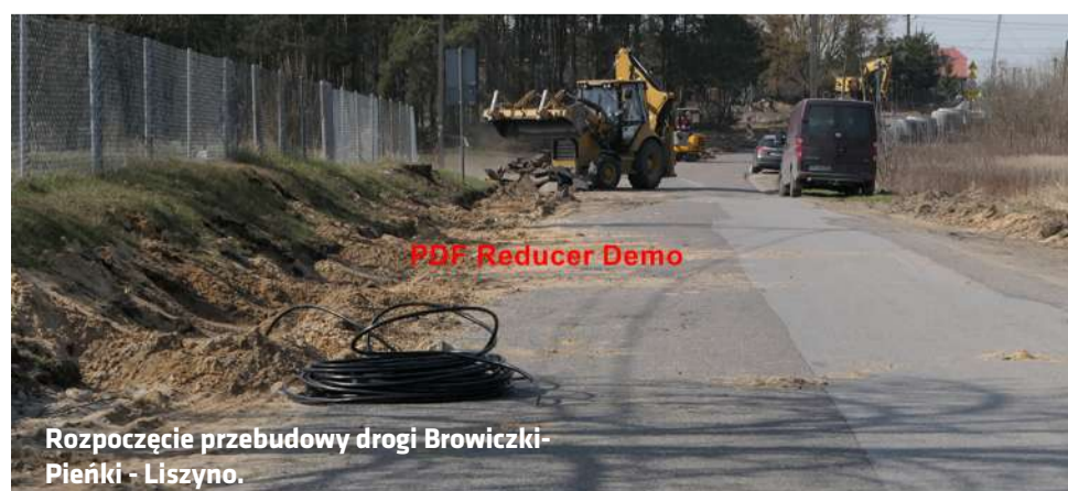
Rozpoczęcie przebudowy drogi Borowiczki-Pieńki - Liszyno.