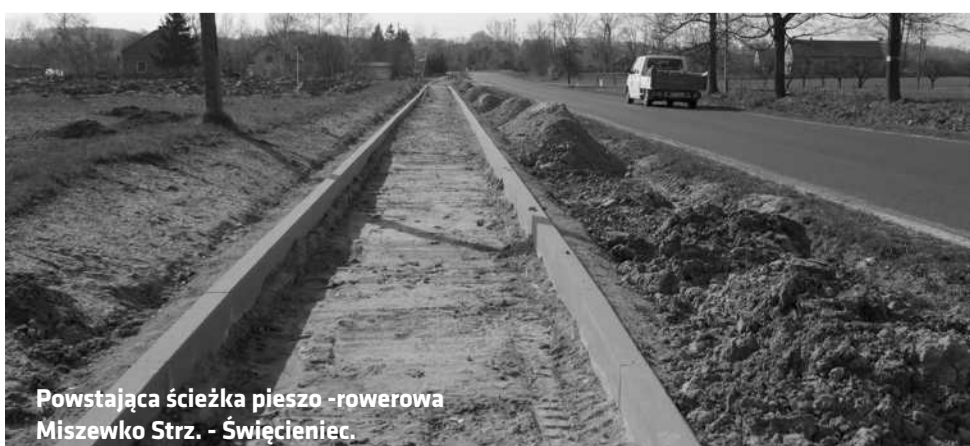
Powstająca ścieżka pieszo -rowerowa Miszewko Strz. - Świącieniec.