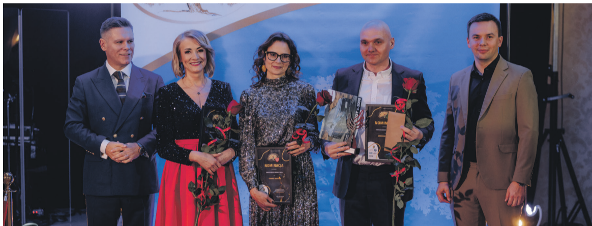
Kategoria: Ambasador Roku 2024