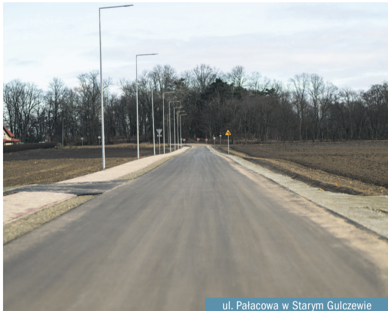
ul. Pałacowa w Starym Gulczewie

2,4 mln zł kosztowały prace na ulicy Pałacowej w Starym Gulczewie. Dziś dzięki budowie drogi w obrębie PGR Gulczewo jest wygodniej i bezpieczniej. Prace przy budowie ulicy wraz z infrastrukturą trwały od lutego 2023 do grudnia 2024 roku. To zadanie realizowaliśmy w formule „zaprojektuj i wybuduj”. Zadaniem wykonawcy była budowa drogi gminnej – ul. Pałacowej na odcinku o długości 767 m.b. od skrzyżowania z drogą powiatową nr 2901W – ul. Rogozińska do skrzyżowania z drogą gminną nr 291202W – ul. Sportowa. Dziś jest tu nowa nawierzchnia asfaltowa do tego wygodny, szeroki chodnik i pobocza. Przy okazji tych prac zadbano o odwodnienie terenu, ale co bardzo ważne powstało oświetlenie uliczne. Prace kosztowały 2,4 mln zł, jednak na to zadanie otrzymaliśmy wsparcie – 2 mln zł z Rządowego Funduszu Polski Ład: Program Inwestycji Strategicznych.