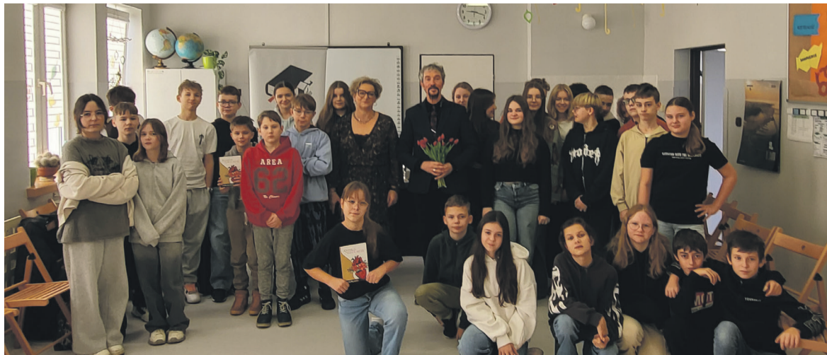
DYREKTOR GMINNEJ BIBLIOTEKI PUBLICZNEJ W SŁUPNIE

W ubiegłym roku nasz księgozbiór został powiększony o ponad 400 publikacji – nowości na rynku wydawniczym. Księgozbiór biblioteki powiększył się również o 200 książek o tematyce historycznej, pozyskanych z Państwowego Instytutu Wydawniczego. Odnotowaliśmy niemal osiem tysięcy wypożyczeń na zewnątrz i prawie czterysta udostępnień na miejscu. W minionym roku zorganizowaliśmy 183 różnorodne formy promocji książek i czytelnictwa, z których skorzystało ponad 2700 mieszkańców Gminy Słupno.