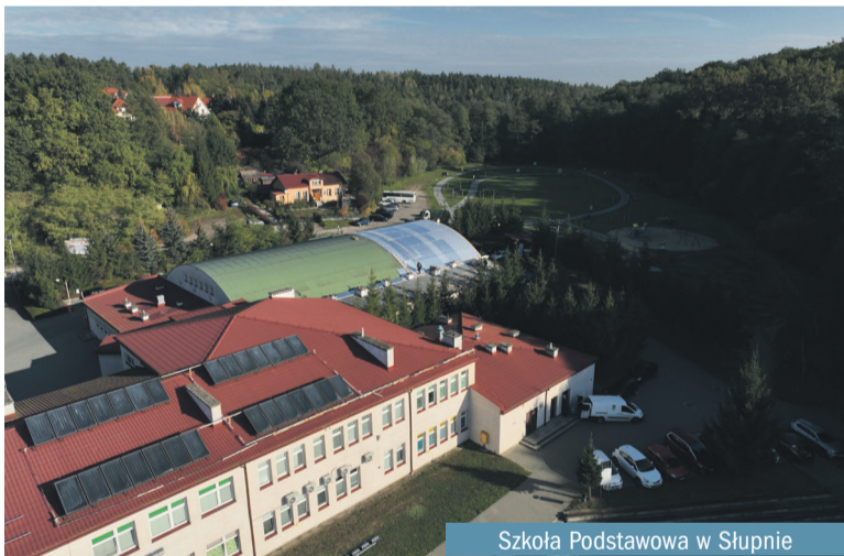
Szkoła Podstawowa w Słupnie