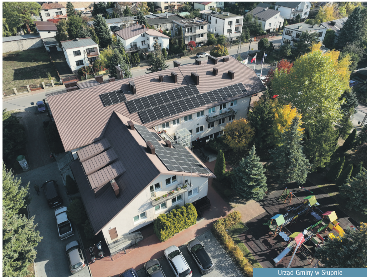
Urząd Gminy w Słupnie

- Obecnie właśnie aktualizujemy wniosek do KOWR-u, bo w grudniu 2024 r. zakończyliśmy budowę i podłączyliśmy do sieci kolejne instalacje. Łącznie na obiektach użyteczności publicznej posiadamy ponad 340kW, to zapewnia obiektom, które są w Spółdzielni wymagane 40% zapotrzebowania, jednocześnie jako Spółdzielnia występujemy do Spółki energetycznej o przysto-