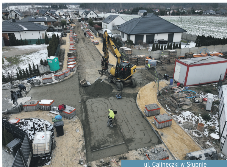
ul. Calineczki w Słupnie

ul Sezamowej i ul. Łącznej. Na głównym ciągu ulicy będą obustronne chodniki. Wykonawca, firma MAG BUD wykona również kanalizację deszczową oraz powstanie oświetlenie uliczne.