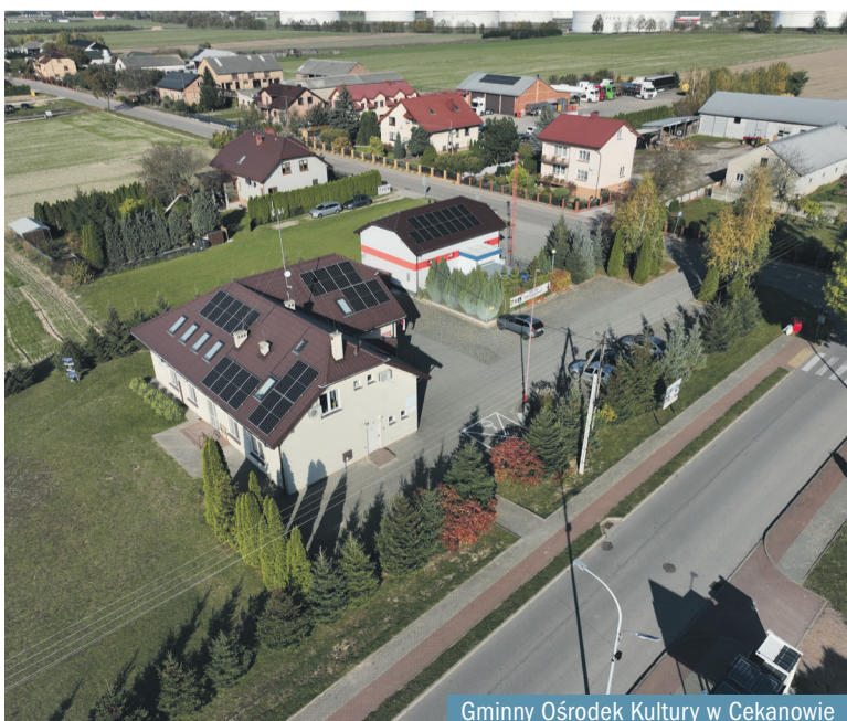
Gminny Ośrodek Kultury w Cekanowie